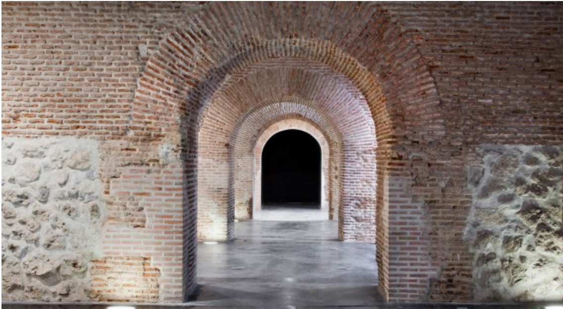
Sala de bóvedas del Centro Cultural Conde Duque donde se desarrollará la Feria.